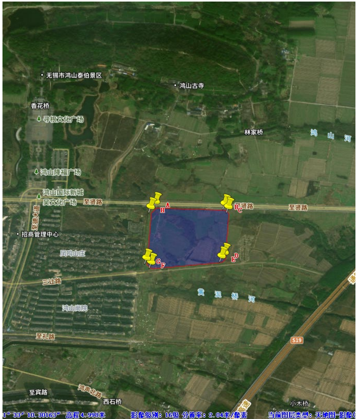
图 1 调查地块范围图